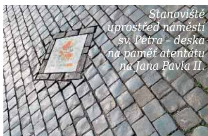
Stanoviště uprostřed náměstí sv. Petra - deska na paměť atentátu na Jana Pavla II.

Nejčastěji jsem patřila do týmu u Bronzové brány, kde se setkávaly tři velké proudy poutníků i turistů. Asi si umíte představit, že právě zde nebyla koordinace vždy nejjednodušší a dotazů bylo každou minutu desítky v mnoha světových jazycích.