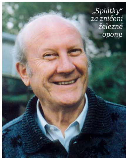
„Splátky“ za zničení železné opony.

(...) Jedna krásná věc o Panně Marii. Jednou mi velitel říká: „Co jste jim říkal těm lidem, těm jezuitům? Hovořil jste proti režimu?“ „Ne, pane kapitáne, to není možné.“ „Vy jste řekl, že režim pomine.“ „To jsem možná řekl. Ne proto, že jsem myslel, že přijde nějaká revoluce, ale proto, že to řekl Ježíš. Ježíš řekl, že všechny věci pominou, jenom Bůh zůstane stále. Pominou tedy všechny věci, které nejsou zakořeněny v Bohu. To je logické.“ A pak říkám: „Víte, pane kapitáne, to řekla Panna Maria.“ „Jak to, že to řekla Panna Maria!? To jsou historiky. Kdo je ta Maria?“ „Je to Ježíšova Matka. A tohle řekla Maria ve Fatimě v roce 1917, 13. října. Že se komunisti obrátí - neřekl jsem, že Rusko - že se komunisti obrátí. Já nemůžu být proti