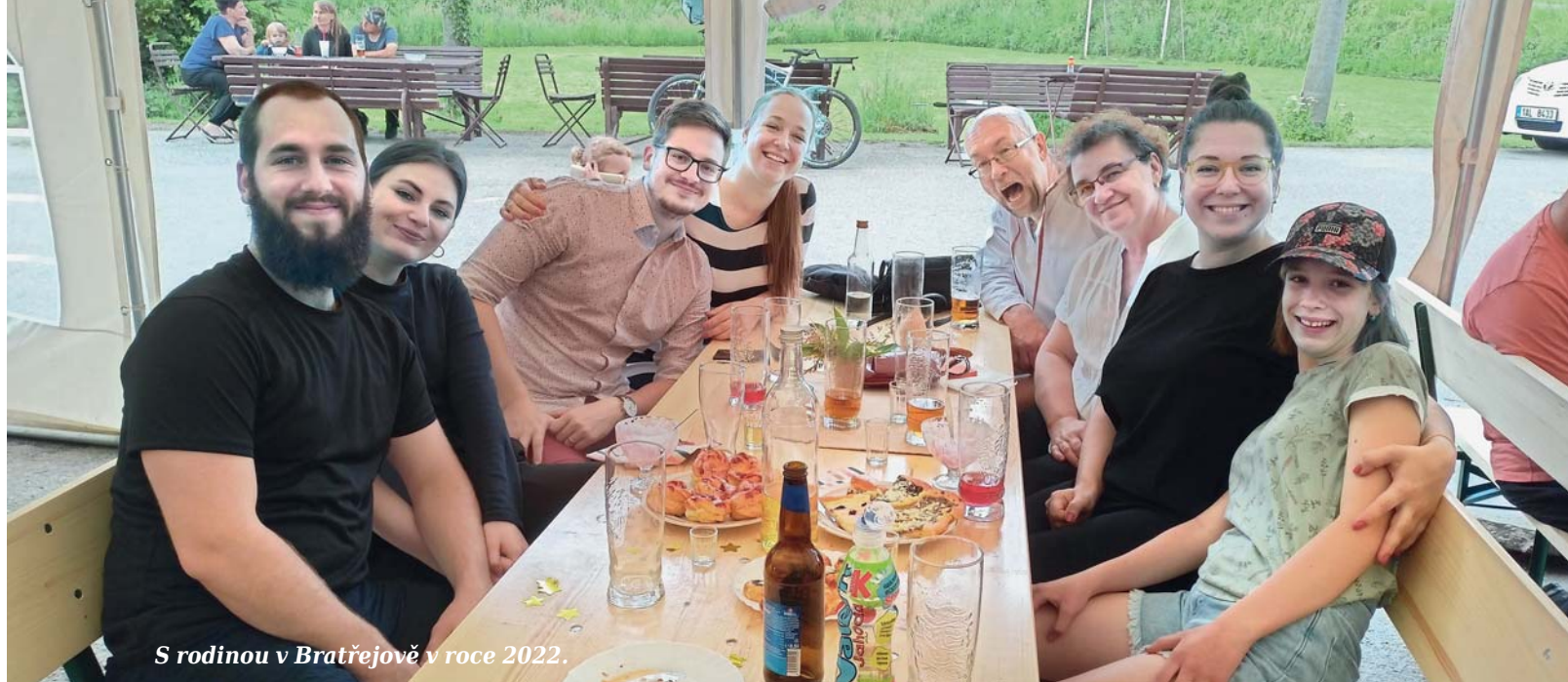
S rodinou v Bratřejově v roce 2022.