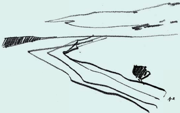
Ilustrační kresba: Petr Ehtler