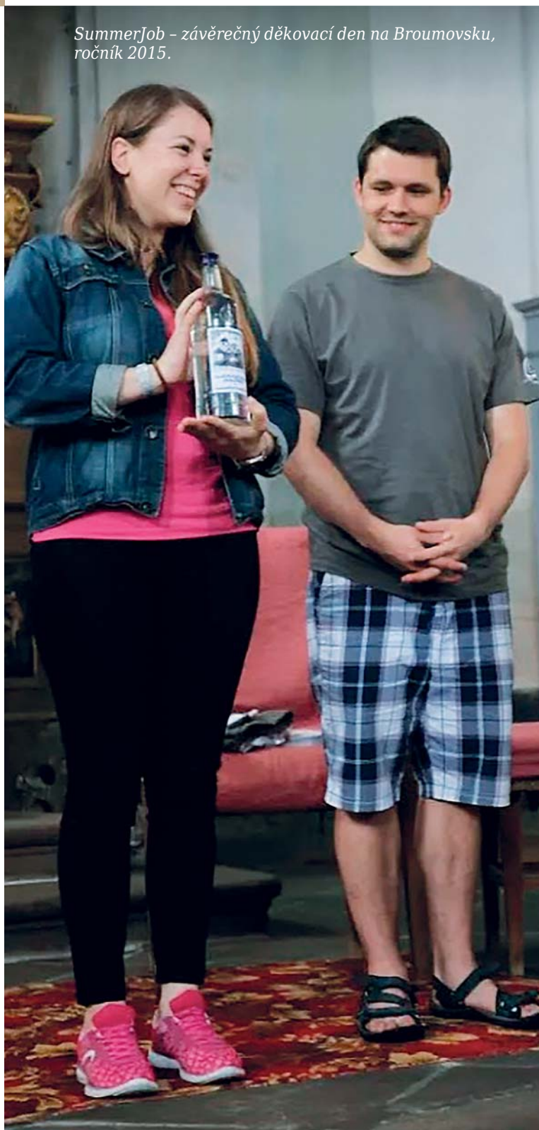
SummerJob – závěrečný děkovací den na Broumovsku, ročník 2015.