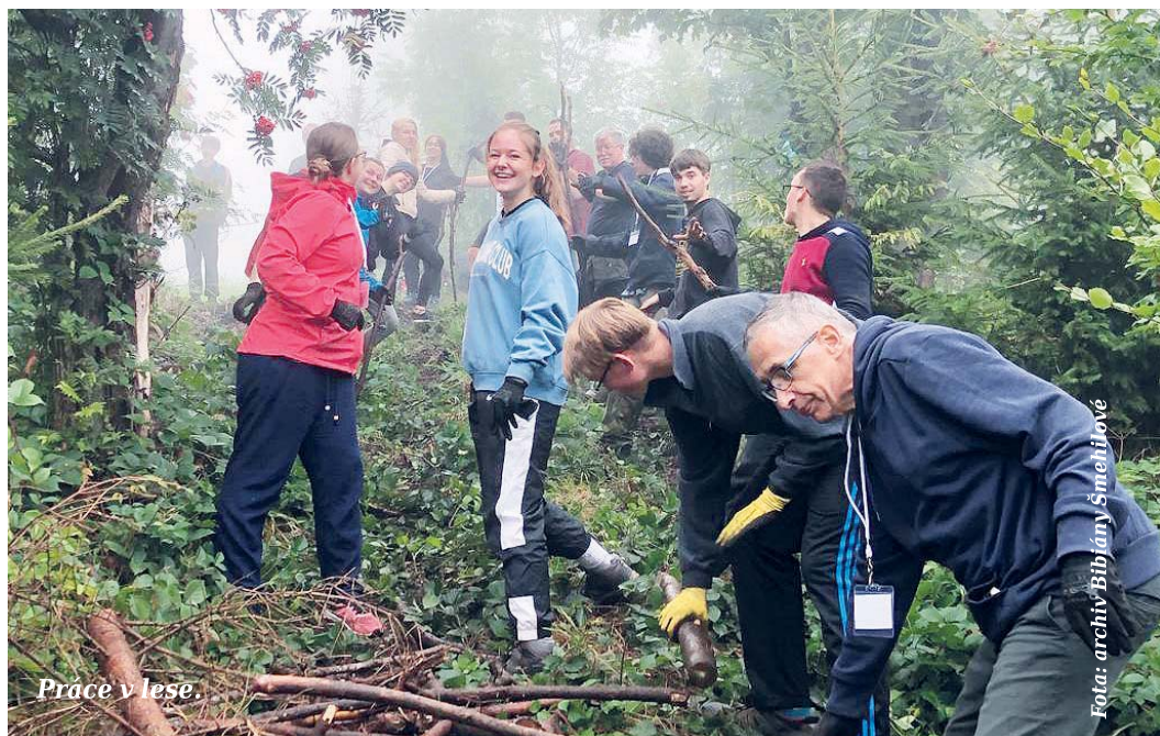
Práce v lese.