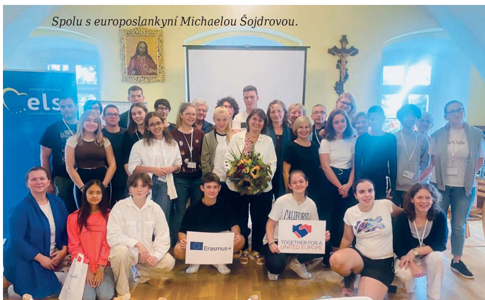
Spolu s europoslankyní Michaelou Šojdrovou.