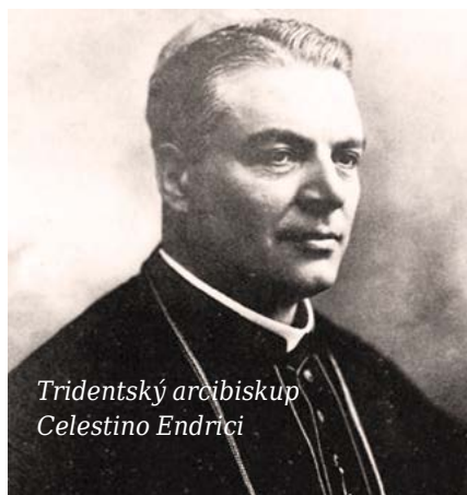
Tridentský arcibiskup Celestino Endrici