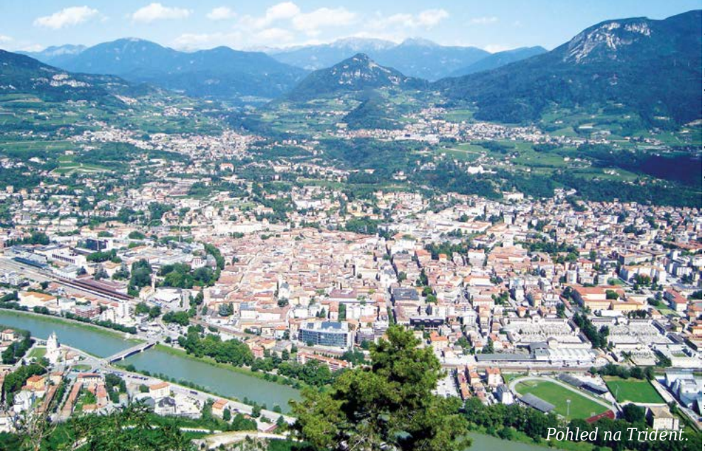
Pohled na Trident.