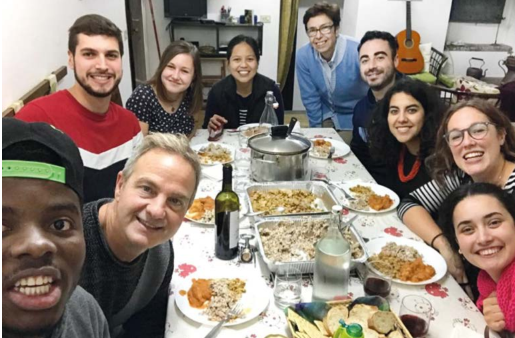
S účastníky „Progetto giovani“ (Projekt pro mladé).

Fokoláre je domov. Když jsem byla v Loppianu první den, brečela jsem radostí z neskutečného množství přijetí, projeveného slovy i fyzicky objetím. Momentálně začínám žít ve vlastním bytě – a opravdu bych zde ráda vytvořila právě takové prostředí, kde každý může být sám sebou, a proto, ale i přes-