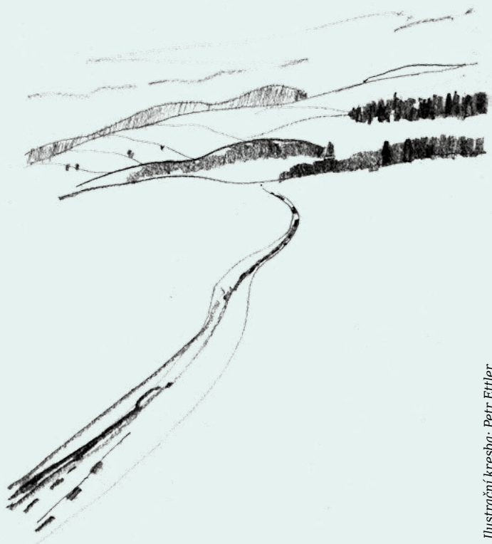
Ilustrační kresba: Petr Ettlér

Tento žalm nám ukazuje člověka, který se cítí obklopen nebezpečím a hrozbami. Potřebuje najít správnou cestu, která by ho konečně dovedla do bezpečí. Na koho se obrátit o pomoc?