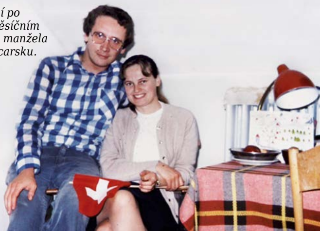
Setkání po osmiměsíčním pobytu manžela ve Švýcarsku.

Začalo to manželovou roční „svatební cestou“. V 50. letech soudruzi zavřeli biblickou školu a kazatelé naší církve studovali na evangelické teologické fakultě. Po Pražském jaru dostalo několik našich studentů možnost studovat rok na