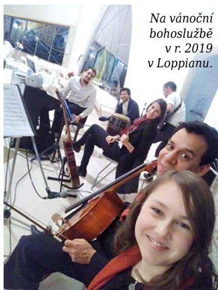
Na vánoční bohoslužbě v r. 2019 v Loppianu.

Díky, Terko! Dvoustranu připravil František Beneš