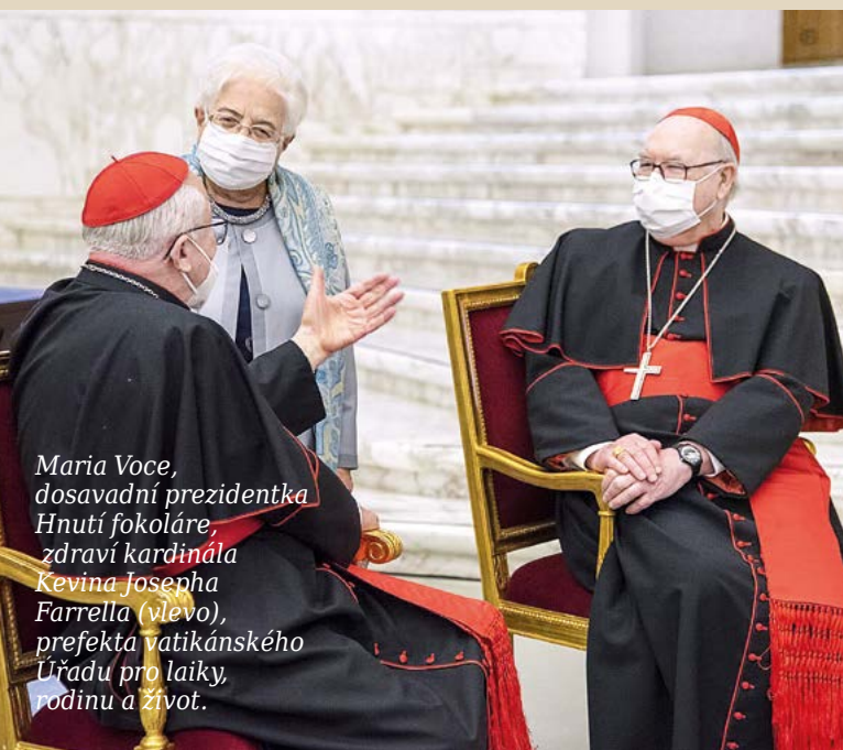
Maria Voce, dosavadní prezidentka Hnutí fokoláre, zdraví kardinála Kevinu Josepha Farrella (vlevo), prefekta vatikánského Úřadu pro laiky, rodinu a život.