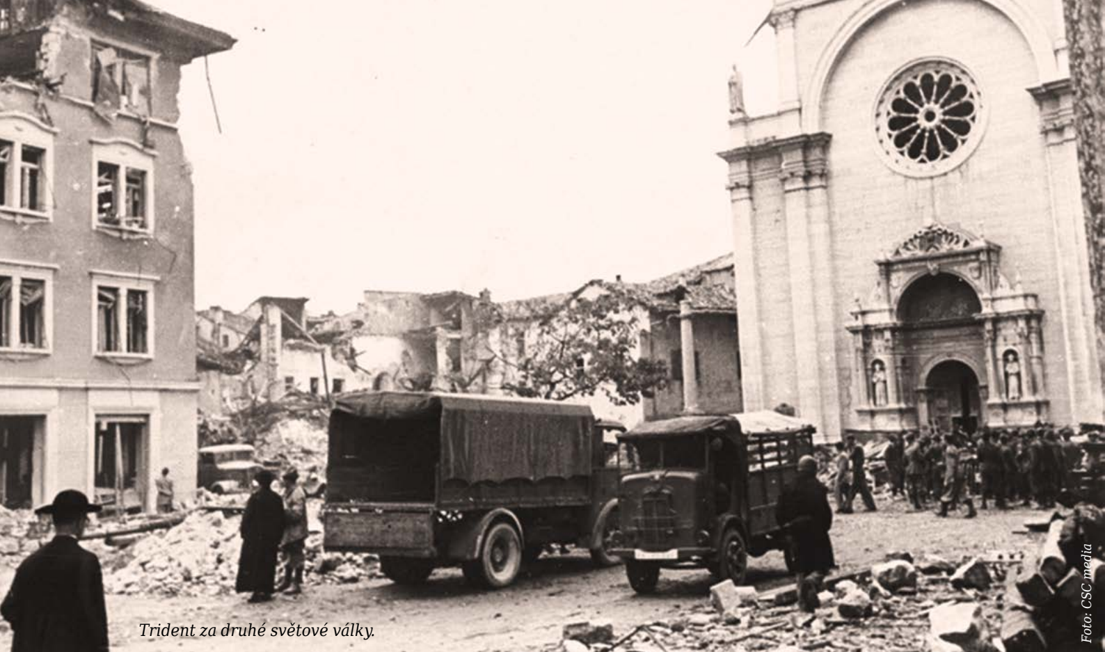
Trident za druhé světové války.